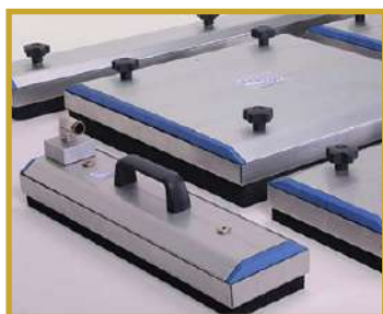
Une large gamme de plaques standards ou sur-mesure