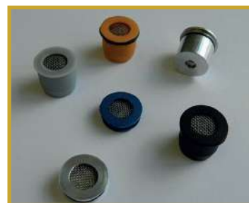
Différents types de valves positionnables