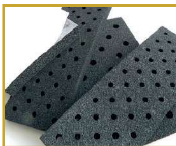
Mousse adaptable à l'application