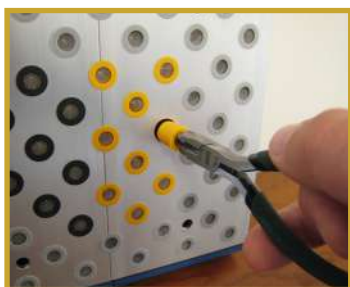
Remplacement simple de la valve